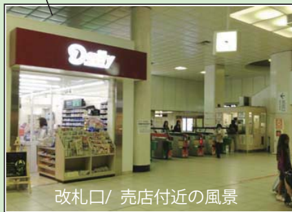
改札口/ 売店付近の風景